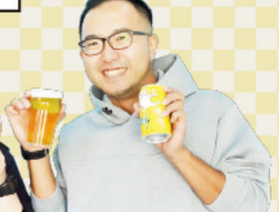
ブルワー歴 9年目 今までつくったビール 僕ビール君ビール ハレの日仙人 ワークスエールなど...