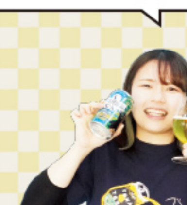
ブルワー歴 3年目 今までつくったビール 軽井沢高原ビール2023年限定 Fruity White Ale ワークスエールなど...